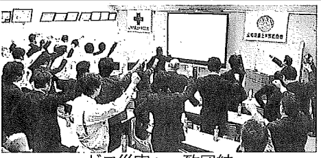
ゼロ災害へ一致団結

開会後、あいさつした山田社長は「今のチャンスを経営に結びつけたら、お客さまに喜んでもらえる安全な工事を行っていたらいい。当社では農場である新田ナーゼ